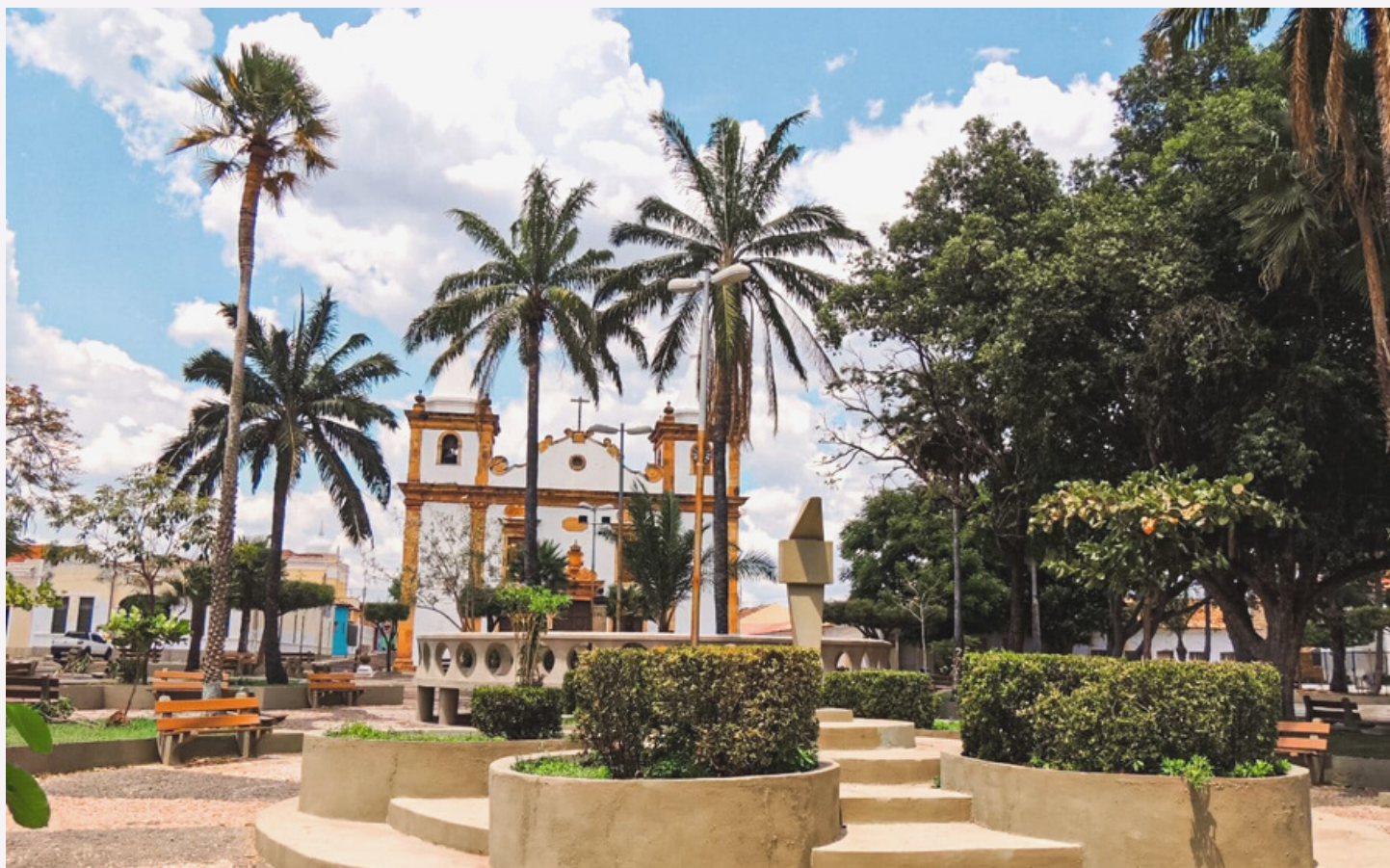
Majestosa praça da Igreja Matriz de Nossa Senhora do Carmo, no município de Piracuruca

Um jornal virtual para as filhas e filhos do Sol do Equador