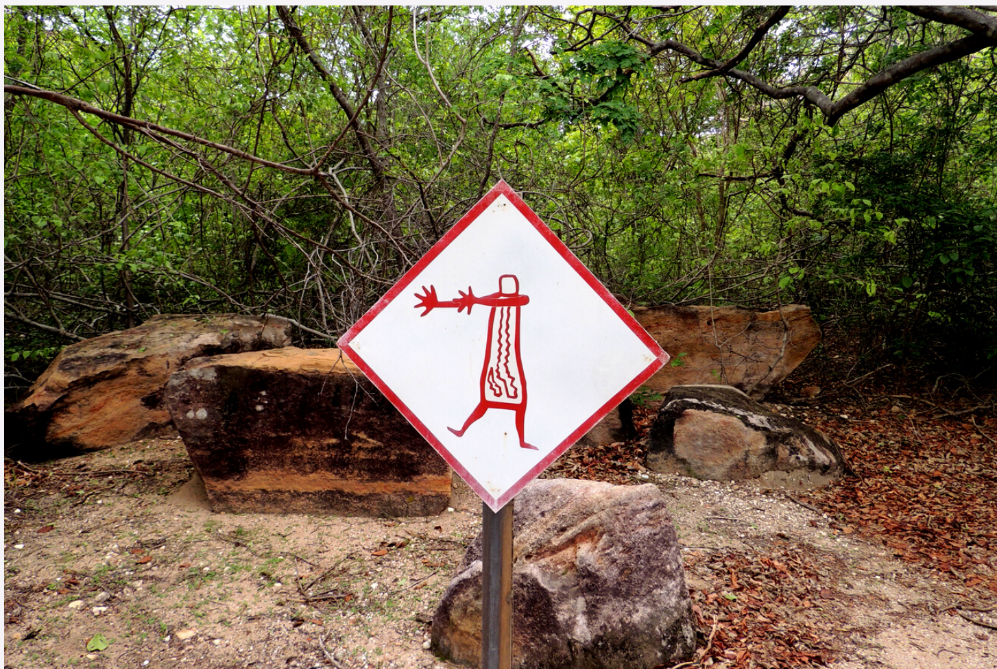
Placa com pintura rupestre apontando o caminho correto no Parque da Serra da Capivara

Um jornal virtual para as filhas e filhos do Sol do Equador