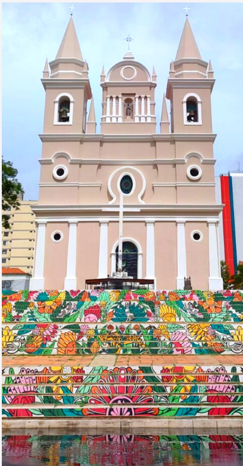
Escadaria da Igreja São Benedito, localizada em Teresina, no Território Entre Rios

Um jornal virtual para as filhas e filhos do Sol do Equador