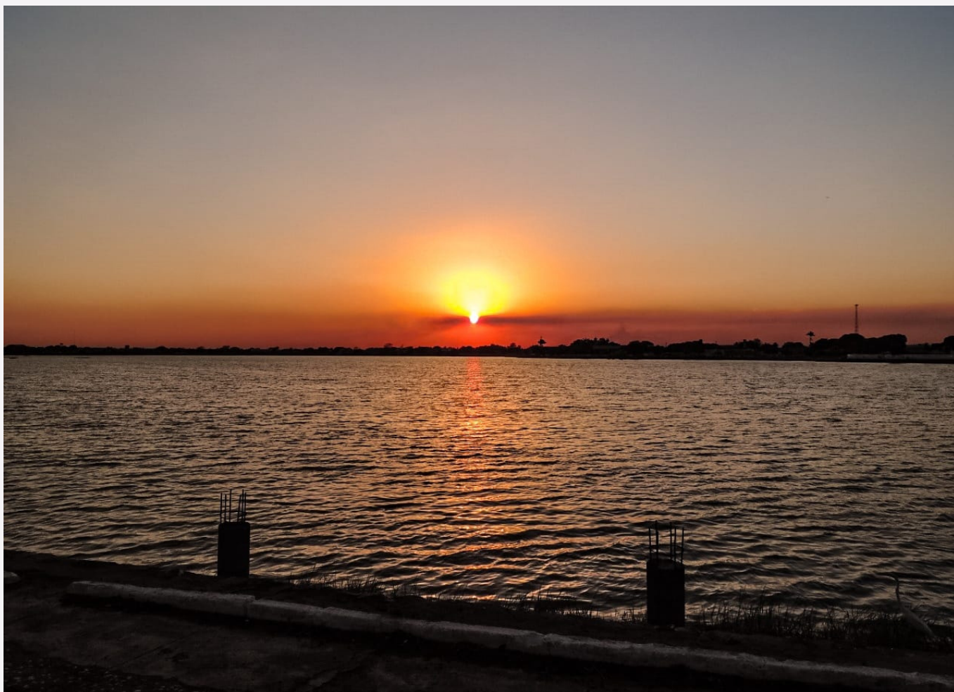
Pôr-do-sol belíssimo do Piauí em Campo Maior, um dos principais municípios dos Carnaubais

Tenho certeza de que tudo vai melhorar, no Piauí e no Brasil. Para o território, estamos com três propostas impactantes de máxima importância. A primeira é um projeto de estruturação e cooperativismo da ovinocaprino cultura, como disse. A segunda, aprovada como prioridade no último Plano Plurianual (PPA), é um consórcio na área de saúde e outro consórcio sobre o sistema de inspeção sanitária.