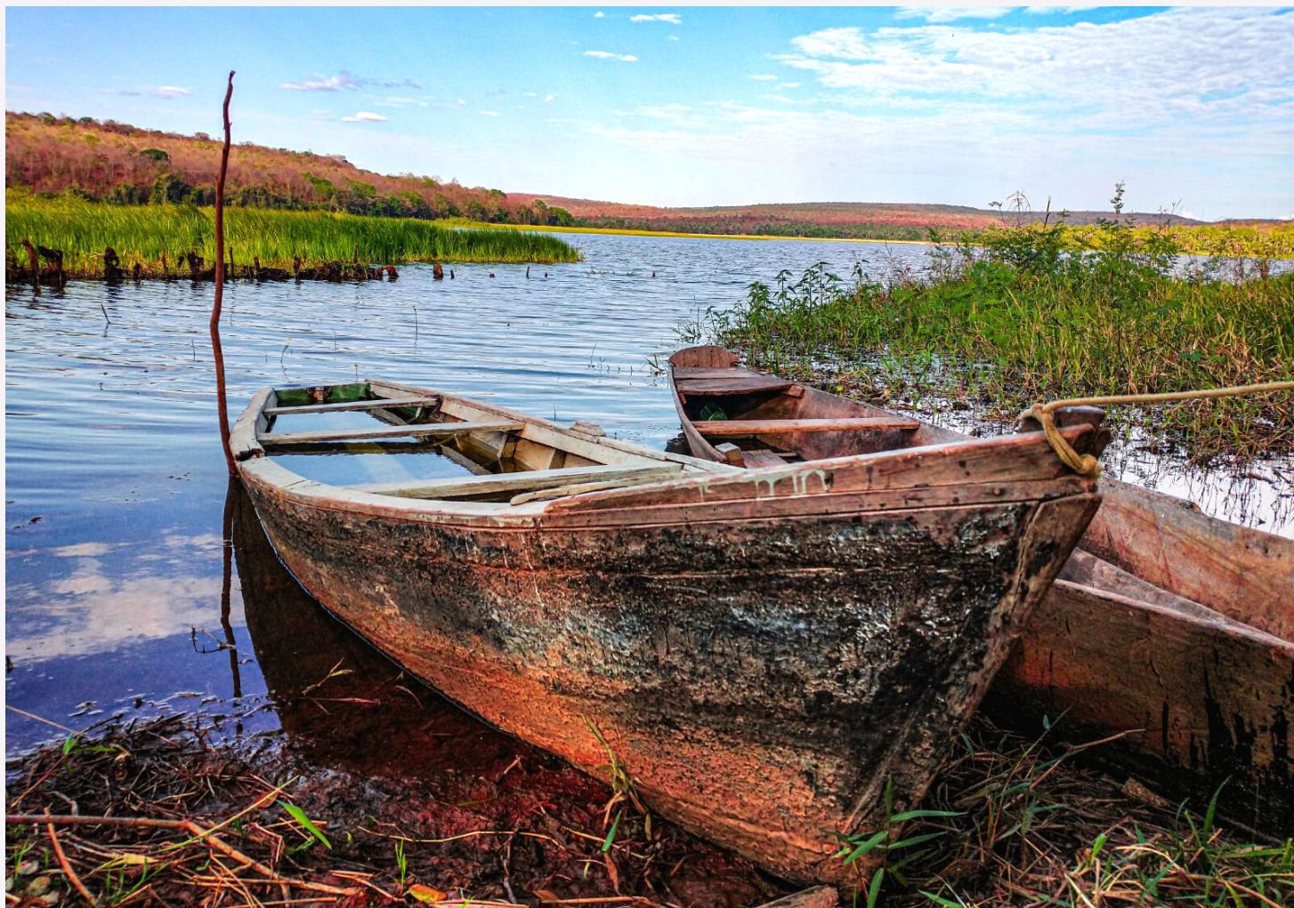
Lagoa no município de Guadalupe, localizada no Território do Alto Parnaíba

Um jornal virtual para as filhas e filhos do Sol do Equador