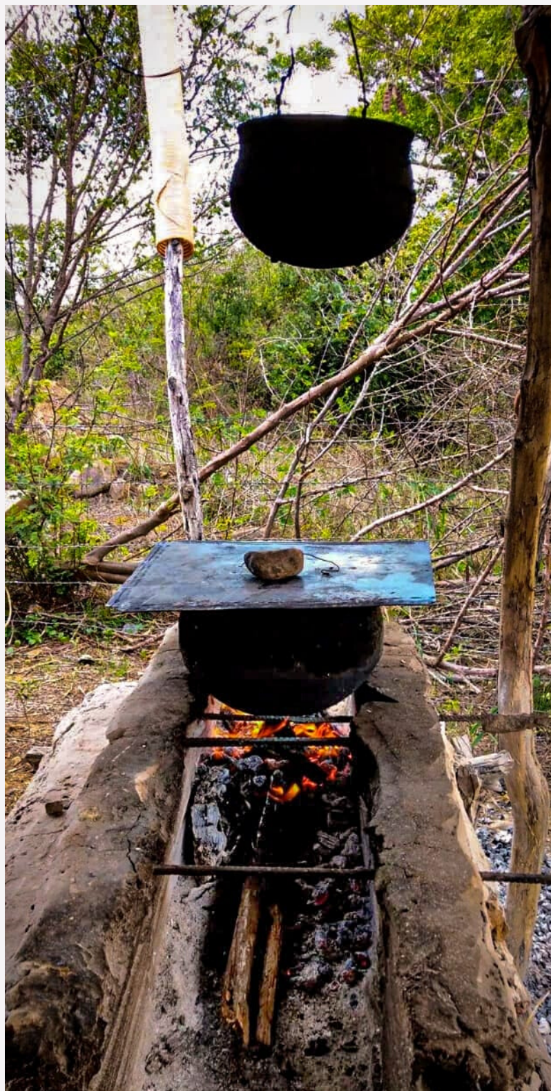
Preparo de almoço em garimpo de opala de Pedro II

Um jornal virtual para as filhas e filhos do Sol do Equador